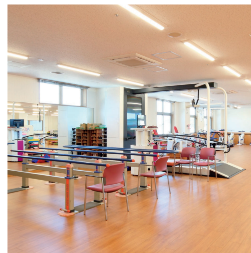
2階 リハビリテーションセンター 「Kakeru」